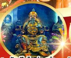
วัดปึกไคฮองอ่า