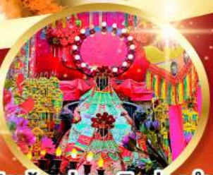
วัดเจ้าแม่กวนอิมฮองอ่า