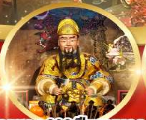
วัดเซกง 600 ปีหยุนหลอง