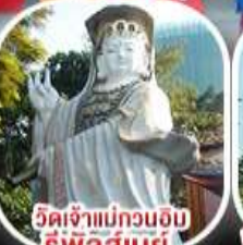
วัดเจ้าแม่กวนอิม รีพัลส์เบย์