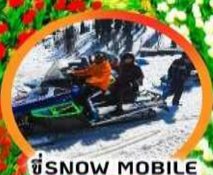
ขี่ SNOW MOBILE