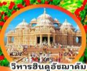
วิหารอินดูอัชมาตัม