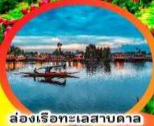
ล่องเรือทะเลสาบดาล