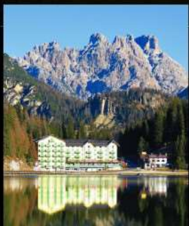
ทะเลสาบบิสุร์น่า