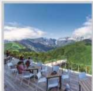
“HAKUBA MOUNTAIN HARBOR”

นำท่านไปไอบกอดธรรมชาติที่ครบครันในที่เดียว “คามิโคจิ” สวิสเซอร์แลนด์แดนญี่ปุ่นเทือกเขาที่ปกคลุมด้วยหิมะสวยงาม ชมความงามของ “ทุ่งพืชมอส ฟุจิชิบะซากุระ” มนต์เสน่ห์..พรมธรรมชาติสีชมพูหลากหลายสีสันสวยสดใส เปลี่ยนอิริยาบถ “ขึ้นกระเช้าฮาคุบะ อิวะตะระ” เพื่อชมวิวพาโนรามาของเทือกเขาแอลป์ญี่ปุ่นกันให้อิ่มใจ สัมผัสกลิ่นอายเมืองเก่า “เมืองทาคายามา” ที่ยังคงอนุรักษ์ความเป็นอยู่ เมื่อสมัยเอโดะกว่า 300 ปี สายช้อปปิ้งห้ามพลาด “คารุอิซาวะ เอ้าท์เล็ต” แลนด์มาร์กของเมืองคารุอิซาวะ และ “ย่านชินจุกุ” แห่งเมืองโตเกียว ชมความงามกับเส้นทาง “เจแปนแอลป์ (กำแพงหิมะ)” สุดยอดของการท่องเที่ยวที่ถูกขนานนามว่า “หลังคาแห่งญี่ปุ่น”