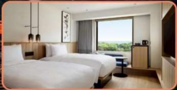
WESTERN STYLE STANDARD TWIN ROOM 25 SQM.