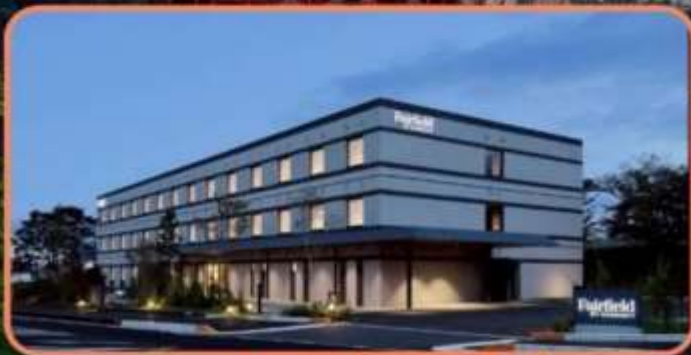
SEA SIDE VIEW