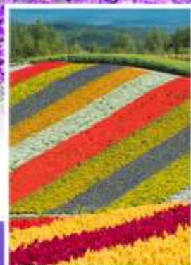
ทุ่งดอกไม้หลากสี