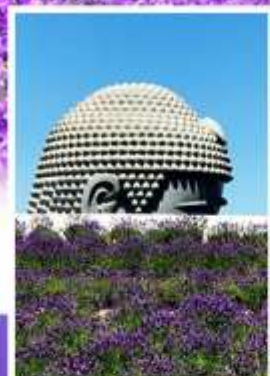
เจดีย์พระพุทธรเจ้า