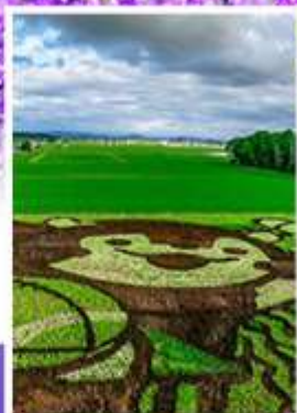
ศิลปะบนทุ่งข้าว