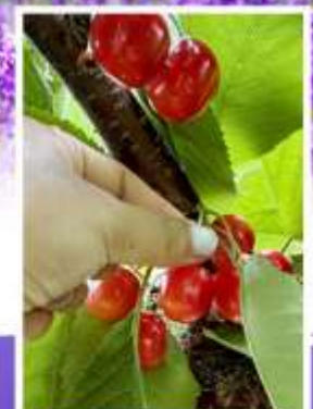
กิจกรรมเก็บเชอร์รี่

ออนเซ็น 2 คั้น นน.กระบี่ 23 กก. 1 ใบ 6Days 4Night