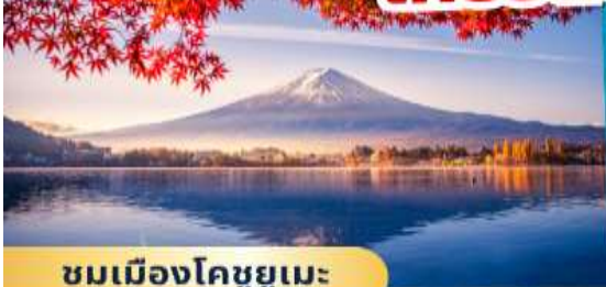
ชมเมืองโคชูยูเมะ