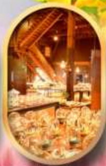
พิพิธภัณฑ์ถ้ำลอดดนตรี