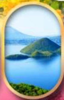
วิวทะเลสาบโทโยะ