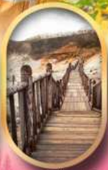
หุบเขาจิกุคาบิ