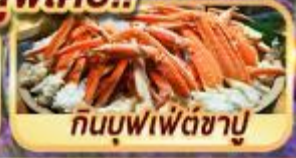
กินบุฟเฟ่ต์ชาบู