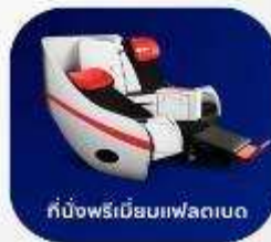
ที่นั่งพรีเมียมเฟลตเบด