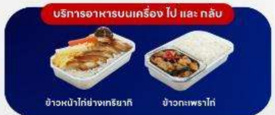
บริการอาหารบนเครื่อง ไป และ กลับ