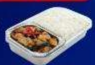
ข้าวกะเพราไก่