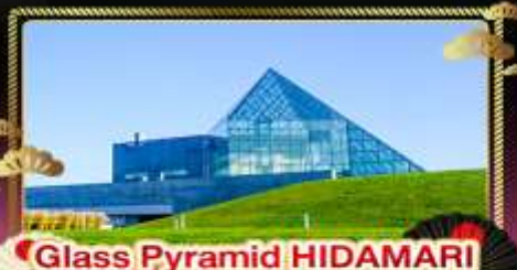
• Glass Pyramid HIDAMARI