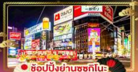
• ช้อปปิ้งย่านซุกุชิโนะ