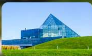
Glass Pyramid HIDAMARI