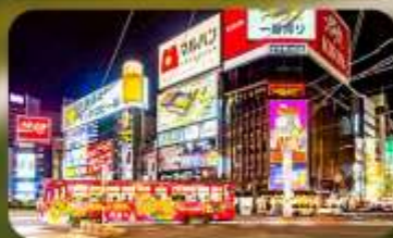
ซุปป์ิงย่านซูซุกิโนะ