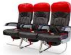
ที่นั่ง Hot Seat

ที่นั่งสุดพิเศษขนาดที่นั่งกว้าง 19 นิ้ว ที่มีความสะดวกสบายขนาด 59 นิ้ว และสามารถปรับเอนราบไปกับเก้าอี้ที่มุมโค้งการ พลิ้ว ด้วยอุปกรณ์อื่นๆ ที่พิเศษเฉพาะที่นั่งพรีเมียมพลอเนอเป็นที่โปรดปรานสำหรับ นายชายดีเลิศที่ชื่นชอบที่นั่งพรีเมียมพลอเนอในเที่ยวบินของแอร์เอเชีย