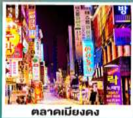
ตลาดเมียงดง