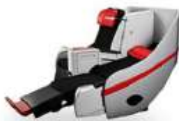
ที่นั่งพรีเมียมพลอเนอ

■ ที่นั่งพรีเมียมพลอเนอ ■ ที่นั่ง Hot Seat ที่นั่งมาตรฐาน ไลบรารีดีโอส เบาะรถเข็น — ที่นั่งทารก ● ลิ้นชัก