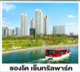
ชองโด เซ็นทรัลพาร์ค