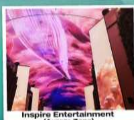
Inspire Entertainment (Aurora Zone)