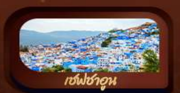
เชฟชาอูน