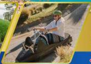
เล่นลู่ที่ควีนส์ทาวน์

✈ บินภายใน (เที่ยวสุดคุ้ม) พักโรงแรม 4 ดาว ★★★★★