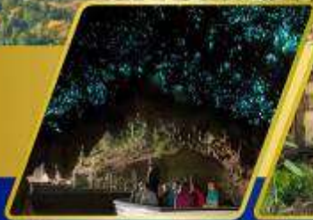
ถ้ำหนอนเรืองแสง