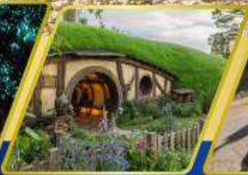
หมู่บ้านฮอบบิต