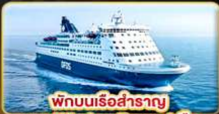
พักบนเรือสำราญ แบบ Window Room 1 คืน