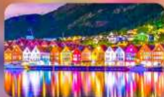
พักเบอร์เกิน 1 คืน