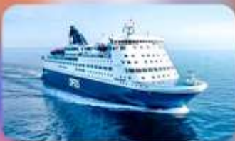
พักบนเรือสำราญ แบบ Window Room 1 คืน