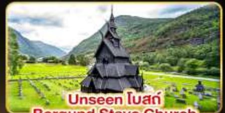
Unseen ใต้น้ำ Borgund Stave Church