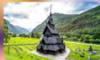
Unseen ไนท์ Borgund Stave Church