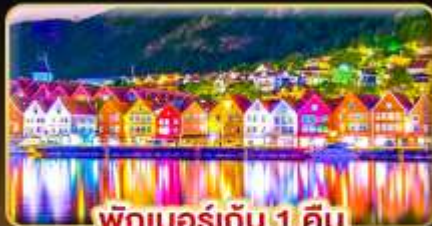
พักเบอร์เกน 1 คืน