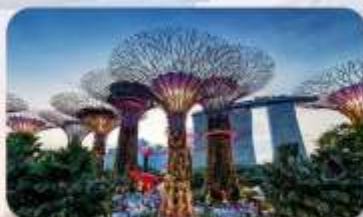
Gardens by the Bay