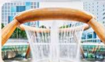
Fountain of Wealth