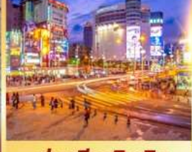
ย่านซีเหมินติง