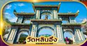
วัดหลันฮั่ง