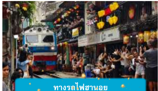
ทางรถไฟฮานอย