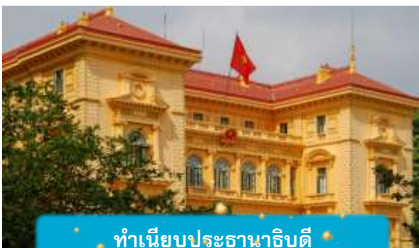
ทำเนียบประธานาธิบดี

เช้า บริการอาหารเช้า ณ ห้องอาหารของโรงแรม นำท่านถ่ายรูปด้านนอก สุสานโฮจิมินห์ จุดเริ่มต้นของการเข้าใจเวียดนาม สถานที่อันเงียบสงบที่สะท้อนจิตวิญญาณของผู้นำผู้ยิ่งใหญ่ สุสานแห่งนี้ไม่ได้เป็นเพียงอนุสรณ์ แต่คือบทเรียนประวัติศาสตร์ที่สัมผัสได้จริง นำท่านเดินทางสู่จุดศูนย์กลางแห่งประวัติศาสตร์เวียดนาม นำชมด้านนอก ทำเนียบประธานาธิบดี อาคารสีเหลืองอร่ามในสไตล์ฝรั่งเศส ที่ยังคงใช้ในพิธีการสำคัญของชาติและชม บ้านพักลุงโฮ บ้านไม้เรียบง่ายริมสระบัว ที่เผยให้เห็นชีวิตสมถะของผู้นำผู้ยิ่งใหญ่ "โฮจิมินห์" สองสถานที่ที่ สองเรื่องราวที่สะท้อนความเป็นเวียดนามอย่างลึกซึ้ง ไม่ใช่แค่ท่องเที่ยว แต่คือการเข้าใจจิตวิญญาณของประเทศนี้อย่างแท้จริง เที่ยง บริการอาหารกลางวัน ณ ภัตตาคาร