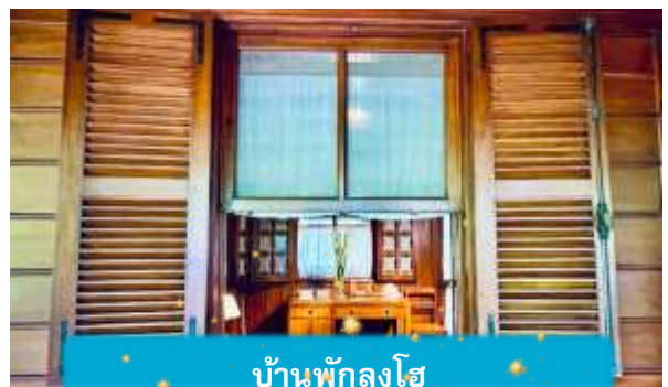
บ้านพักลุงโฮ