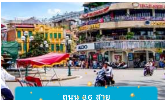
ถนน 36 สาย

21.05 เดินทางถึง สนามบินสุวรรณภูมิ ประเทศไทย โดยสวัสดิภาพ ... พร้อมความประทับใจ